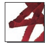
Coupe croisée 4x40 mm Niveau de sécurité DIN 3 Documents confidentiels.